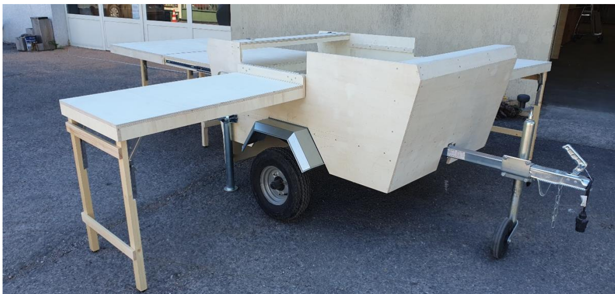
La Remorquette® en position ouverte